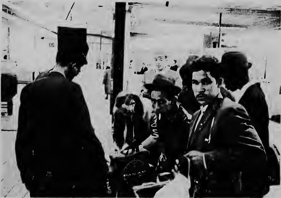
Despues di yegada na aeropuerto di Schiphol e formalidadnan necesario mester a ser hasi.

Na su manera Ds. Mietes a muestra e hobennan riba nan derecho y debenan di un manera agradable y a avisanan principalmente